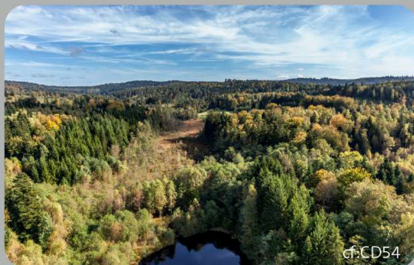
Tourbière de basse altitude