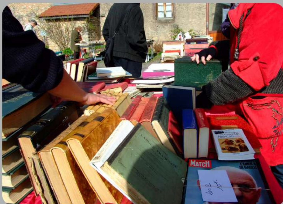
Grand déballage Fontenoy-la-Joûte

Circuit entretenu et balisé par le Club Vosgien d'Azerailles