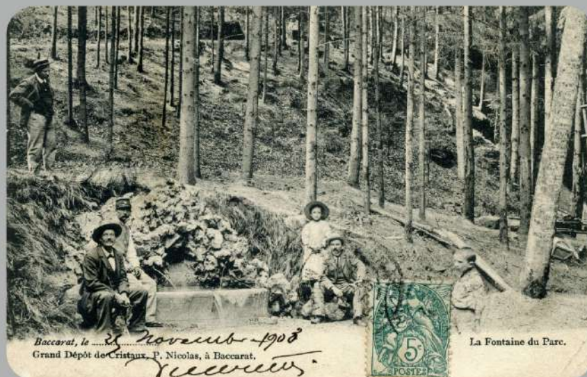
Fontaine du Parc