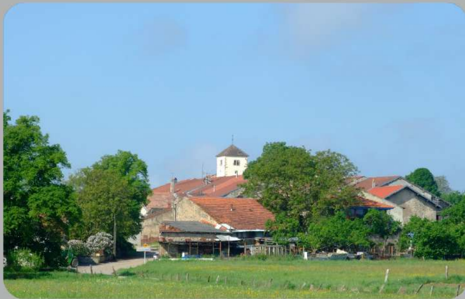
Commune de BROUVILLE

Circuit entretenu et balisé par le Club Vosgien d'Azerailles